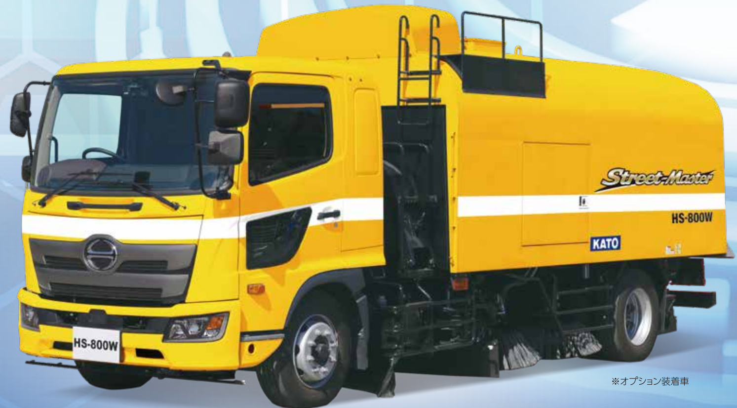
※オプション装着車