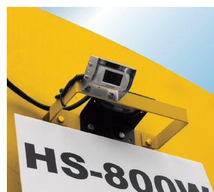
▲後方確認カメラ (オプション)