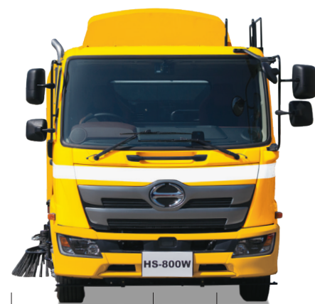
右側ブラシ・片側吸込み 1,750mm 右側ブラシ・両側吸込み 2,525mm