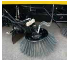
▲ガッタブラシ油圧チルト仕様