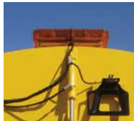
▲LEDタイプ薄型黄色回転灯 (各公安委員会で許可が必要)