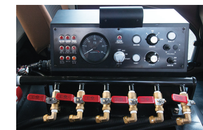
▲多彩な機能を効率よく配列。新型操作パネル