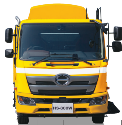
左側ブラシ・片側吸込み 1,750mm 左側ブラシ・両側吸込み 2,525mm