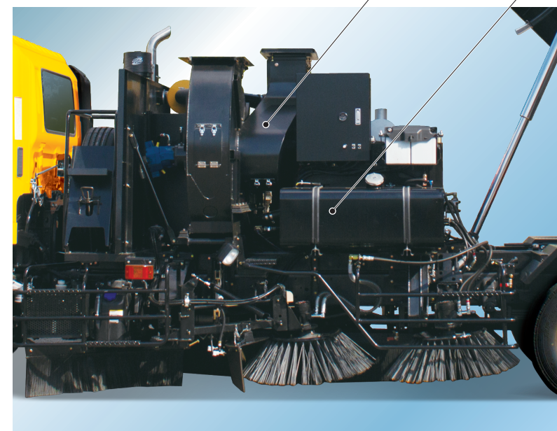
▲清掃装置は全油圧式。メンテナンス効率も大幅にUP! メンテナンス時、キャブ外単独操作パネルで各装置操作も可能。