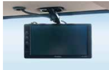
▲後方確認カメラ用モニター