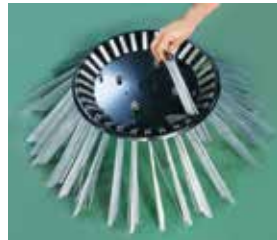
▲交換が簡単! KATO独自の カセット式 ブラシ