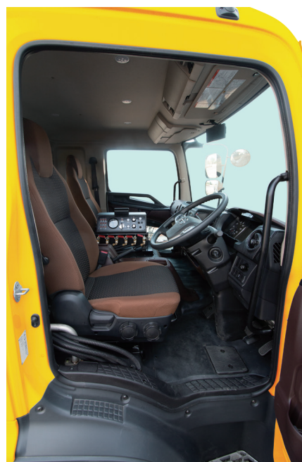
ゆったりと開放感のある▲ 2名乗車キャビン