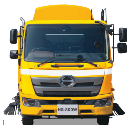
両側ブラシ・両側吸込み 3,500mm (オプション)

※清掃幅は、シャシメーカーにより異なる場合があります。 ※可動式車幅灯は、道運送車両法による保安基準の緩和条件として必要な場合のみ取り付けます。 ※オプション装着車