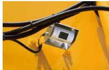
▲後方確認カメラ ドライブレコーダー付きもあります