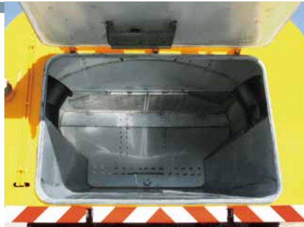
▲総ステンレスで耐久性、メンテナンス性が高い、大容量・耐腐食性ホッパ