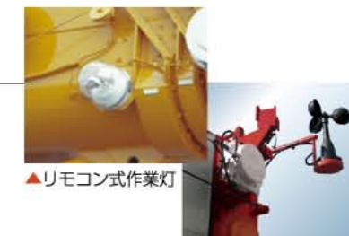
▲リモコン式作業灯