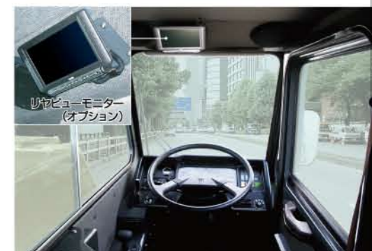
▲走行時の視界も良好・キャリヤキャブ