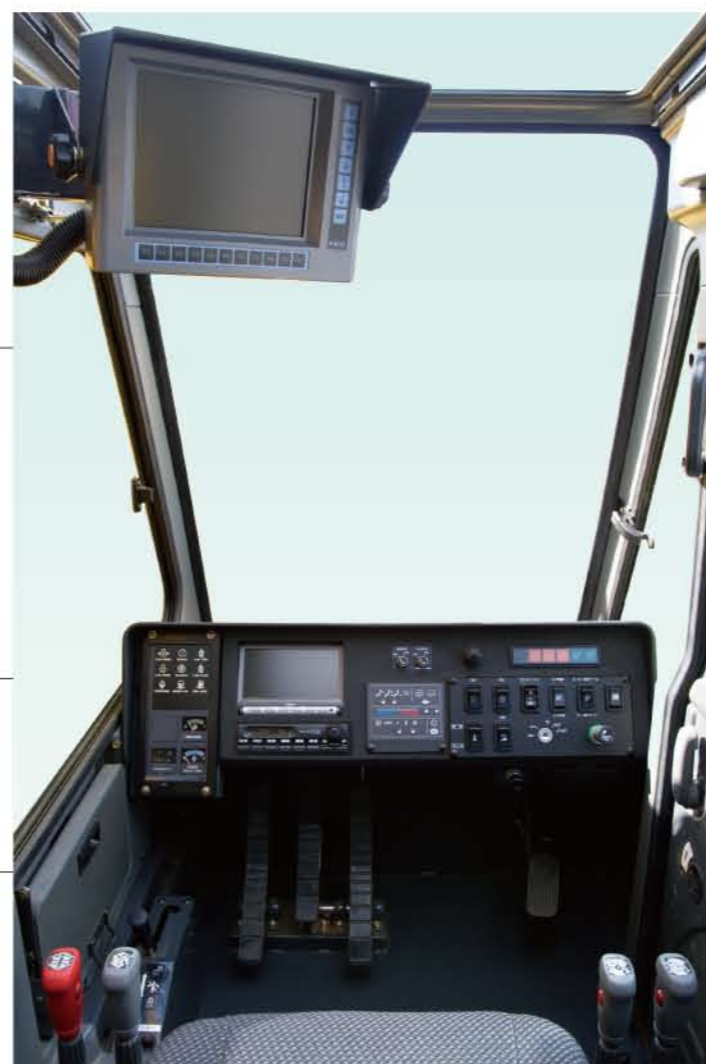
▲オペレータキャブ